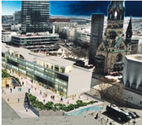
Das neue alte Bikini-Haus, nun „Bikini Berlin“

Seit Dezember 2010 wird das Ensemble durch die Bayerische Hausbau revitalisiert. Das Motto des Projektes Bikini Berlin lautet „Lebe anders“. Hier soll ein Ort jenseits konventioneller Architektur, Stadtplanung oder herkömmlicher Einkaufszentren entstehen.