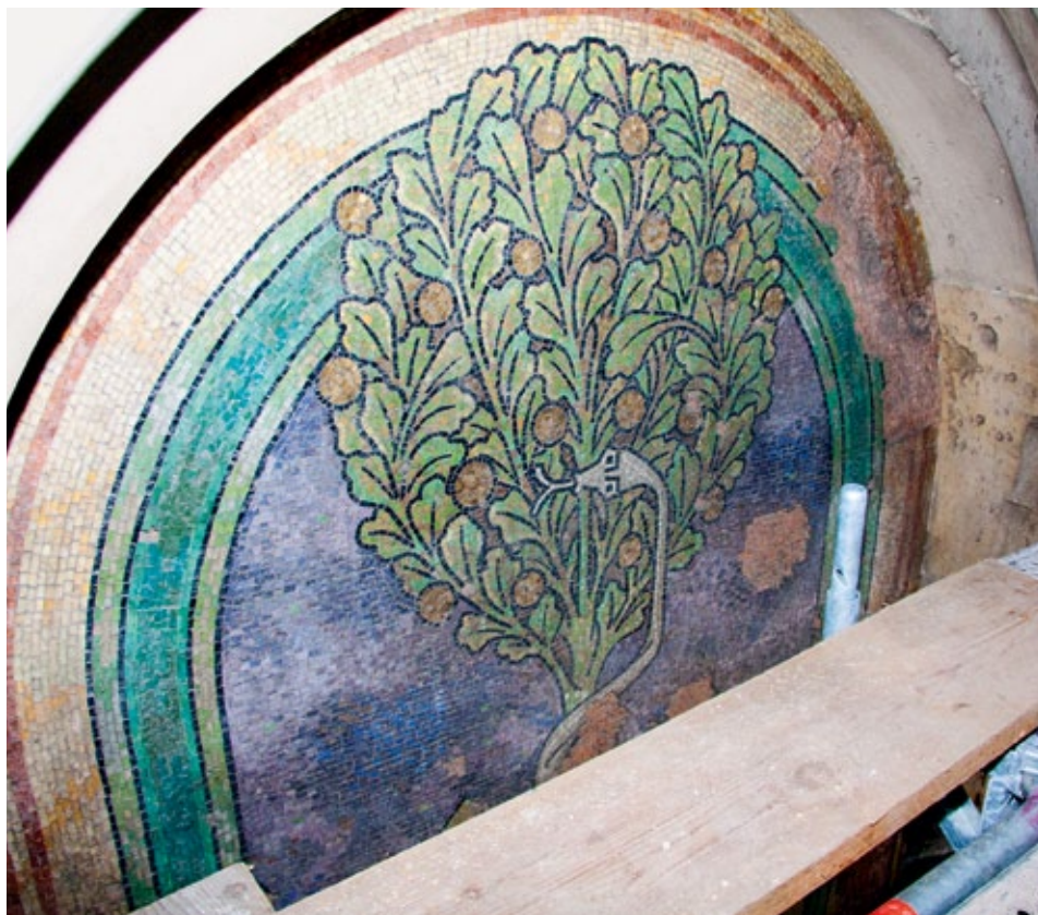
Mosaikdetail in luftiger Höhe